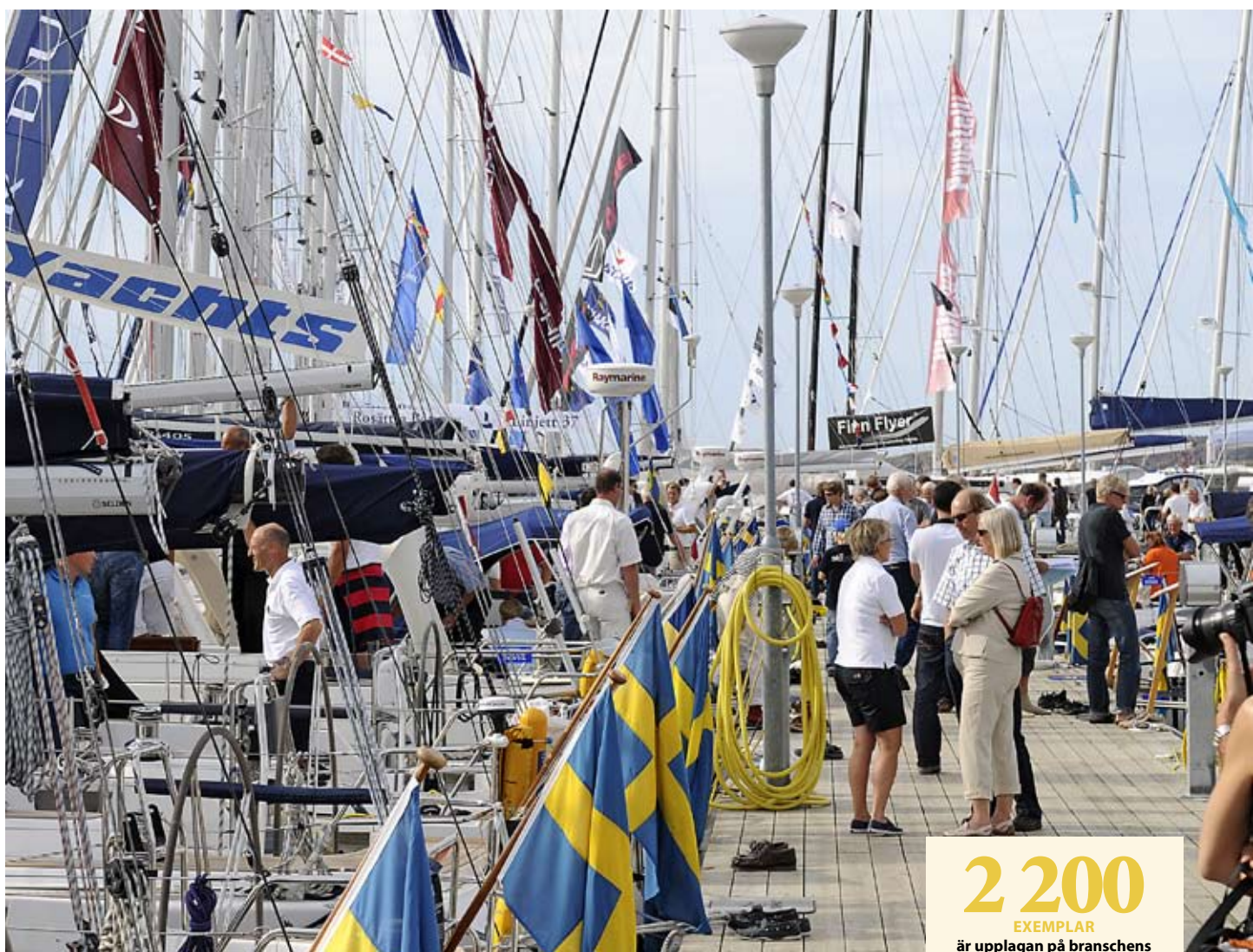
Mässorna är viktiga mötesplatser för Båtbranschen. Öppna Varv 2009 var välbesökt och hölls som vanligt i augusti.

UTGIVNING. Tidningen läses ofta, av många på varje företag, vilket ger en lång livslängd.